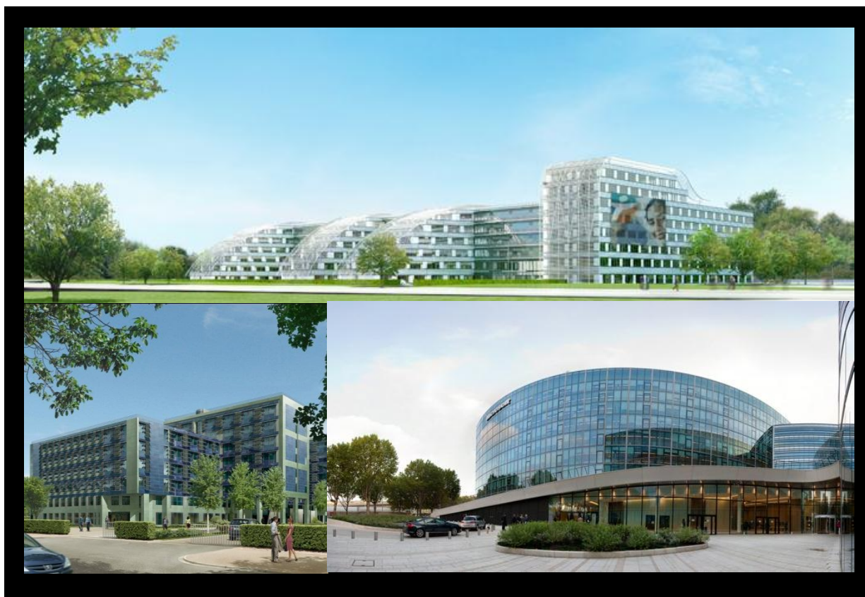
Objectifs d'emplois et de locaux d'activités et commerces