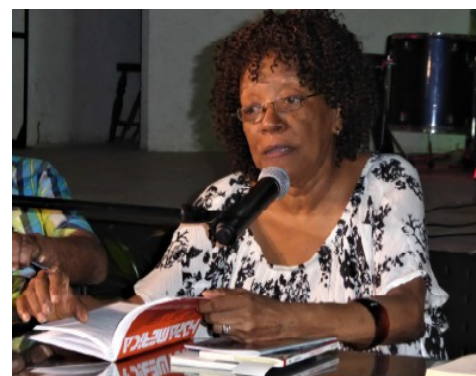
Nancy Morejón Hernández