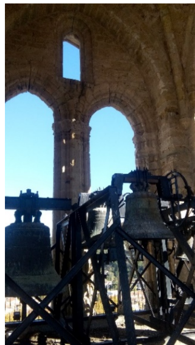
Diverses vues du clocher de l'ancienne cathédrale de Lodève