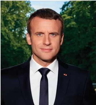
Emmanuel Macron Président de la République