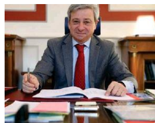
Étienne GUYOT , Préfet de la Région Occitanie, Préfet de la Haute-Garonne

Je tiens à saluer la mobilisation sans faille de l'ensemble des acteurs qui ont contribué au déploiement de la Stratégie en construisant des chaînes de solidarités inédites. Néanmoins, la pauvreté demeure, hélas, à un niveau encore élevé et justifie la poursuite de la mobilisation de tous.