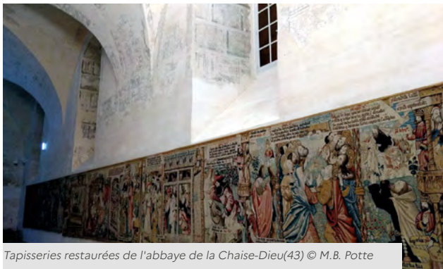
Tapisseries restaurées de l'abbaye de la Chaise-Dieu(43)

Pour le patrimoine n'appartenant pas à l'État, d'importantes opérations ont été financées dans les départements de l'Allier, de l'Ain, de l'Ardèche, du Cantal... L'État est aussi intervenu pour assurer les opérations de consolidation d'urgence de l'église du Teil, fortement affectée par le tremblement de terre du 11 novembre 2019.