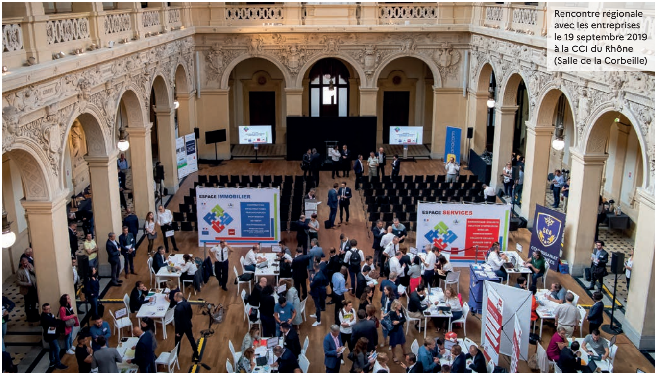
Rencontre régionale avec les entreprises le 19 septembre 2019 à la CCI du Rhône (Salle de la Corbeille)