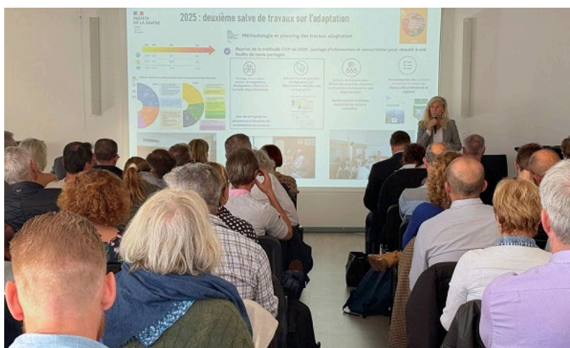
3 e réunion de la COP 73 organisée le 3 novembre à Albertville

À ce stade, les priorités portent principalement sur les effets de la chaleur notamment pour les personnes vulnérables), les enjeux en matière d'eau (à la fois sur la dimension risque, inondation notamment et sur le volet ressource), les impacts sur les infrastructures (routières, ferroviaires, d'énergie...), sur les bâtiments et les espaces publics (îlots de chaleur) ainsi que sur l'agriculture et les forêts.