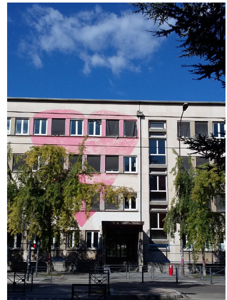
6,97 M€ DE FRANCE RELANCE POUR LA DÉMOLITION ET LA RECONSTRUCTION COMPLÈTE DU LYCÉE EMMANUEL MOUNIER - GRENOBLE (38)