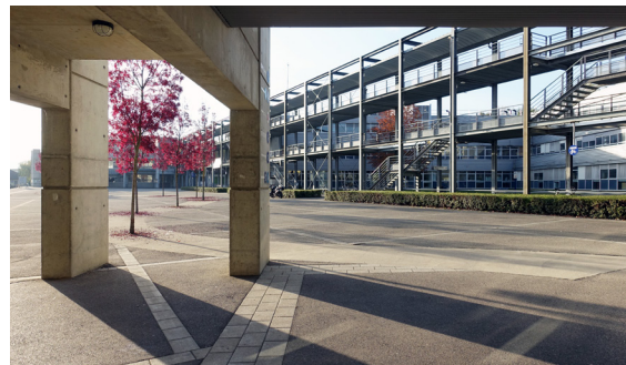
UNIVERSITÉ SAVOIE MONT BLANC TECHNOLAC BOURGET-DU-LAC (73) : 859 500 € POUR LA RÉFÉCTION ET L'AMÉLIORATION DE L'ISOLATION ET LE REMPLACEMENT DE CHAUDIÈRES GAZ PAR DES CHAUDIÈRES BOIS.

En deuxième lieu, ils permettront de soutenir les jeunes étudiants en améliorant leurs conditions de vie et de formation : 141 projets de rénovations financés en Auvergne-Rhône-Alpes concernent des universités mais également d'autres établissements de la