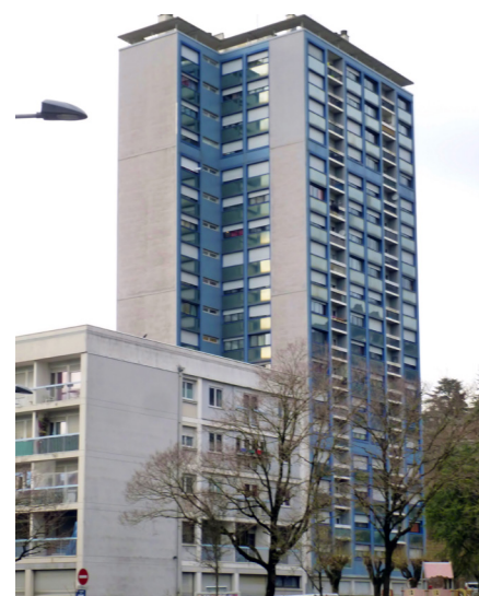
QUARTIER DE LA MÉRANDE - CHAMBÉRY (73)