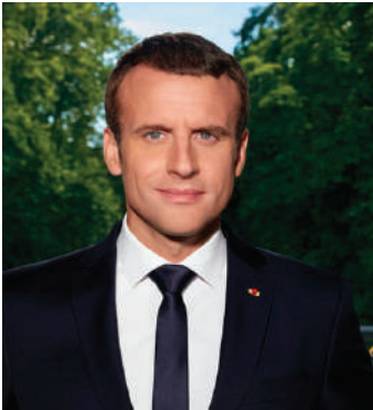
Emmanuel Macron Président de la République