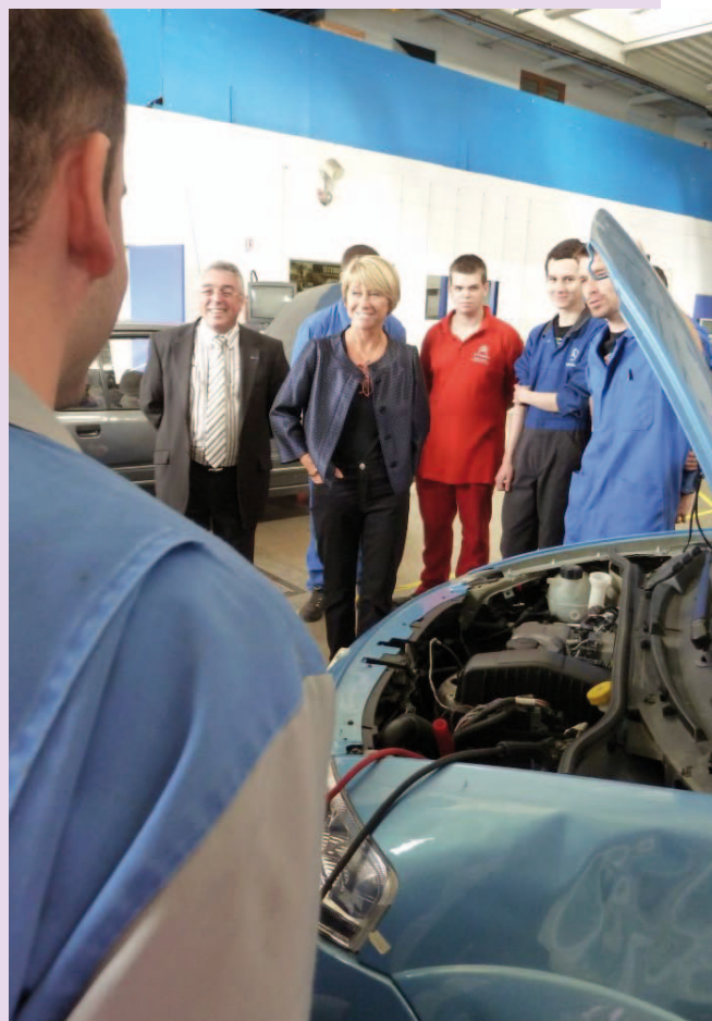
Anne Boquet, Préfète de région, en visite au CIFA d'Auxerre le 9 septembre dernier

➤ L'Etat participera à cet effort à hauteur de 37,5 millions d'euros sur 5 ans.