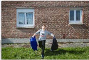
Are you ready ?