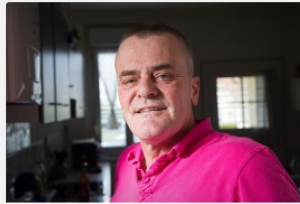
Portraits d'habitants #6