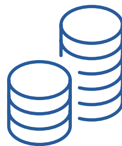
Répartition des dossiers par mesure