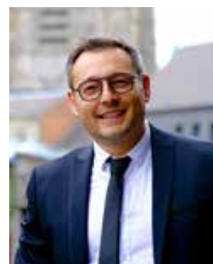
Sébastien Seguin , maire d'Avesnes-sur-Helpe

Je salue l'idée de l'État d'avoir mis en place le Fonds vert, réelle opportunité qui va enfin nous permettre d'éliminer cette friche, véritable verrue présente depuis des décennies, afin d'améliorer le cadre de vie des habitants d'Avesnes le bas ! »