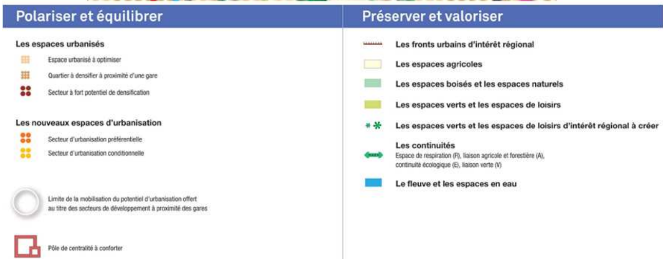
Figure 1 : Extrait de la Carte de destination générale des différentes parties du territoire, SDRIF 2030, version adoptée par le Conseil régional le 18 octobre 2013

Les secteurs opérationnels principaux (secteur du Mont d'Est-Maille Horizon, la Cité Descartes, la zone des Richardets et la gare Noisy Champs) sont identifiés par le SDRIF comme des secteurs à forts potentiels de densification ou des quartiers à densifier à proximité d'une gare.