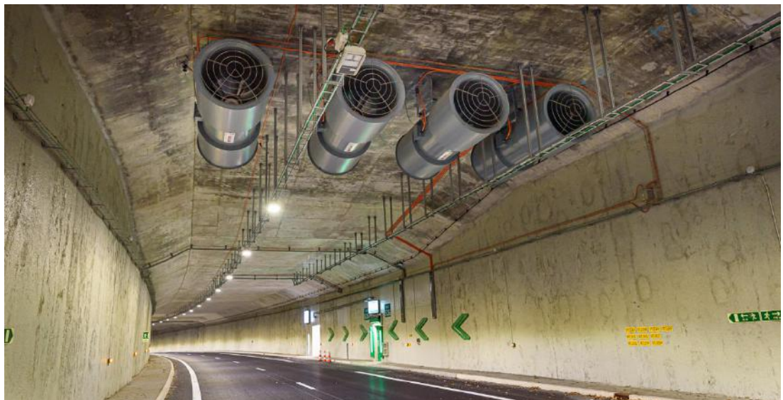
Accélérateurs pour la ventilation