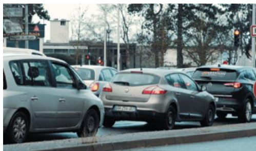
Trafic sur l'ancienne RN19 en traversée de Boissy-Saint-Léger

La mise en service de la déviation de la RN19 à Boissy-Saint-Léger permet de fluidifier le trafic et d'optimiser les déplacements. C'est aussi le moyen d'apaiser la circulation à Boissy-Saint-Léger en reportant en dehors du centre-ville le trafic de transit qui empruntait initialement l'avenue du Général Leclerc (ancienne RN19).