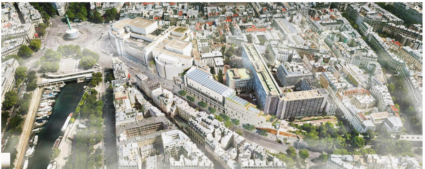
Insertion architecturale du projet sur vue aérienne Illustration à titre indicatif

Ce projet est conçu par le groupement Henning Larsen Architects, Reichen et Robert & associés, CET Ingénierie, Peutz et associés et Ducks Scéno.