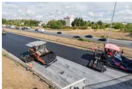
Rénovation des chaussées de la Francilienne..

De manière générale, sur l'ensemble de l'année, 2 fois plus de chaussées seront rénovées en 2022 comparé à 2017 : au total environ 160 km de chaussées doivent être rénovés cette année, contre 69 km qui l'ont été en 2017. Ainsi les travaux d'été 2022 sont révélateurs d' un investissement de l'État qui s'est significativement accru ces dernières années.