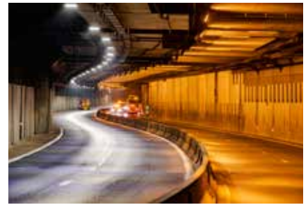
Modernisation de l'éclairage des tunnels de Fresnes et Antony.