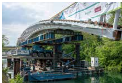
Pose d'une travée de la passerelle piétons-cycles du pont de Nogent.

Point d'échange entre l'A4 et l'A86, le pont de Nogent relie les communes de Nogent-sur-Marne et Champigny-sur-Marne. Les aménagements routiers achevés en 2019 ont permis d'améliorer les conditions de circulation de cet ancien point de congestion emblématique du réseau routier de l'Est parisien. Les travaux réalisés actuellement visent à sécuriser au mieux les déplacements doux et à limiter les nuisances dues au trafic routier.