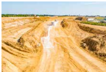
Terrassement pour le Contournement Est de Roissy.

Le contournement Est de Roissy (CER) consiste à réaliser 9 km d'autoroute à 2 x 2 voies (A104), 7 km de route départementale (RD212) et 8 ouvrages de franchissement entre l'échangeur de Compans et l'échangeur de l'A1/A104. Les aménagements prévus permettront d'assurer la continuité de la Francilienne, de favoriser le développement économique du territoire et d'améliorer l'accès à l'aéroport Paris-Charles-de-Gaulle.