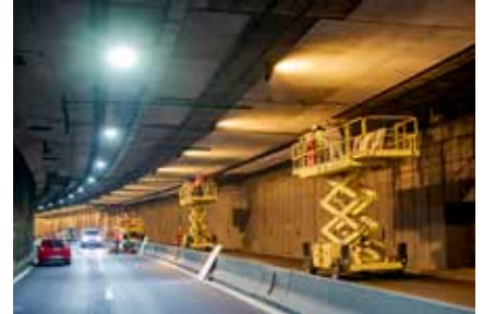
Pose de plaques de protection au feu dans les tunnels de Fresnes et Antony.