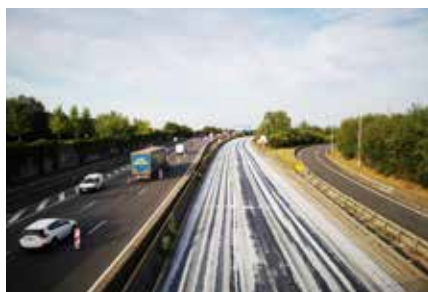
Rénovation des chaussées de la RN184.

Certaines opérations de rénovation de chaussées sont remarquables :