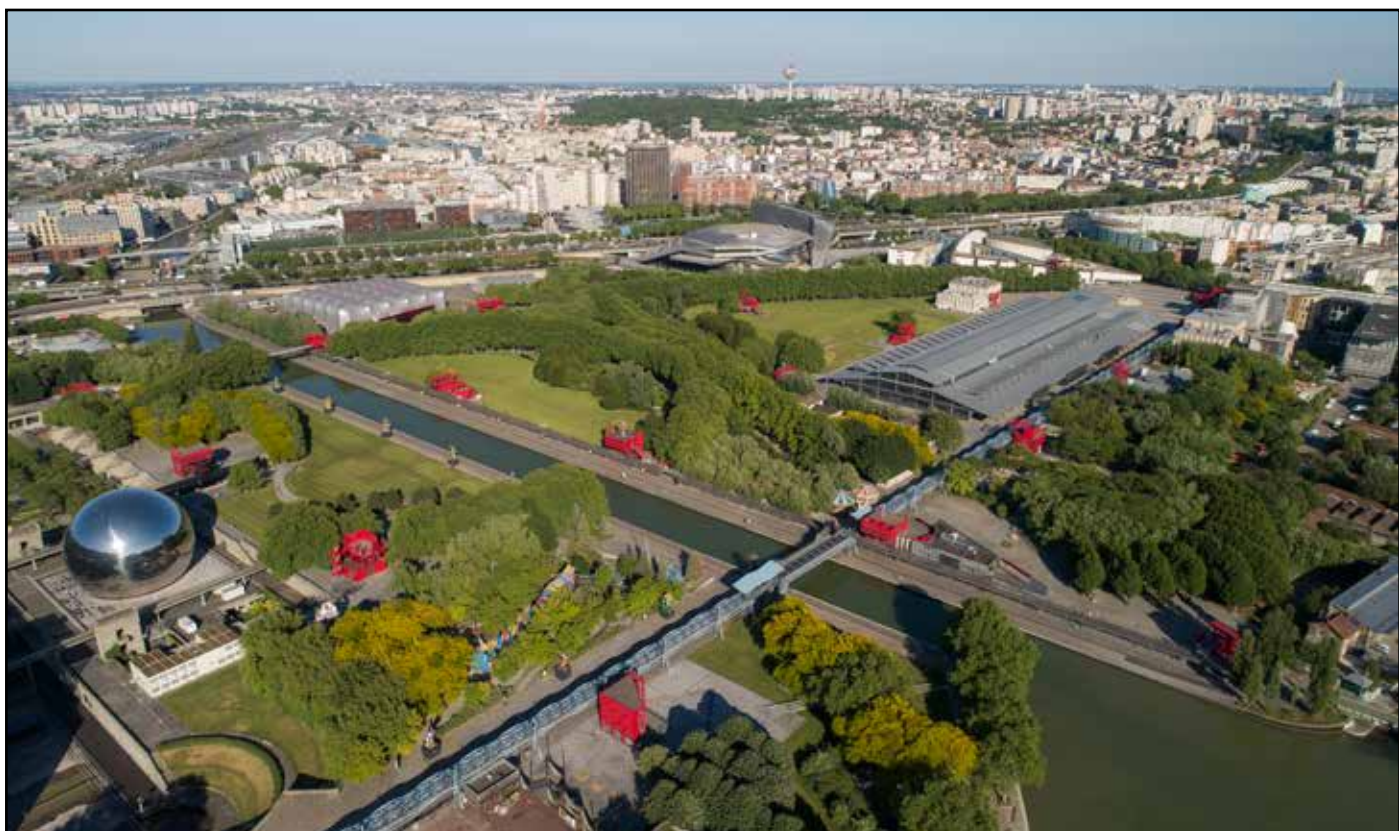
Le parc de la Villette (19 e )

Cet environnement multiculturel sera aussi un espace de démonstration artistique. Dans le cadre des Olympiades Culturelles lancées par le ministère de la Culture et portées par le Comité d'organisation des JOP et la DRAC de la préfecture de la région Île-de-France, vingt écoles nationales supérieures d'architecture (ENSA) seront invitées à créer vingt pavillons éphémères dans le Parc de La Villette. Depuis plusieurs mois, les élèves conçoivent des prototypes démonstrateurs d'une architecture écologique, sobre et réemployable, en résonance avec les folies de l'architecte Bernard Tschumi qui ponctuent déjà les 55 hectares du Parc. Les 20 « Archi-Folies » seront montées sur site au printemps et accueilleront pendant les Jeux au Club France les fédérations sportives françaises. Structures éphémères, les archi-folies pourront après les Jeux être léguées aux fédérations et aux collectivités qui en feront la demande.