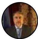
Thierry MAILLES, sous-préfet de Fontainebleau

Parmi les lieux des jeux Olympiques et paralympiques en Île-de-France, 13 communes, par ailleurs centre de préparation aux Jeux, vont offrir une programmation culturelle ou agro-gastronomique. Huit communes proposeront une programmation culturelle tournée vers la culture de la délégation qu'elles accueillent et 5 communes développent un programme valorisant l'agriculture et la gastronomie francilienne. Les acteurs au cœur de ces projets nous en disent plus.