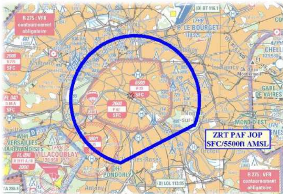
Extrait carte 1/250 000 RP SIA - Édition 1 - 2024