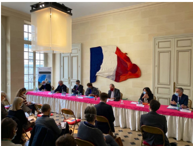
Hôtel de Noirmoutier : classement du Sacré-Coeur de Montmartre

2021 sera une année de transition pour le SRCI avec la mise en œuvre d'une politique de communication plus offensive sur les réseaux sociaux, le développement de nouveaux supports et la refonte des outils de communication interne.