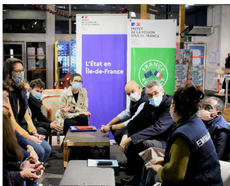
Visite d'Emmaüs Défi, chantier d'insertion et laboratoire d'innovations sociales luttant contre la grande exclusion

La crise sanitaire de 2020 s'est traduite par une crise sociale qui frappe durement les quartiers prioritaires : à cet égard la connaissance fine des territoires concernés et de l'évolution de leurs besoins a permis de concevoir ou déployer rapidement des actions déployées au bénéfice des habitants (montée en charge du Programme Régional Insertion Jeunesse (PRIJ), accroissement de l'aide alimentaire, Cités éducatives, distribution de 1000 tablettes à des jeunes pour lutter contre la fracture numérique, etc.) dans ce contexte de crise sanitaire.