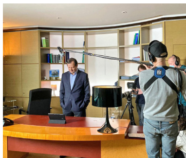
Tournage de la web-série Matière grise

La crise sanitaire a amené le SRCI, dont la majorité des agents travaillaient à distance, à réorganisé son activité afin d'accompagner l'ensemble des services dans leurs actions de communication autour de la pandémie ou sur d'autres sujets. Dans le cadre d'actions de communication interne, les supports de communication ont été repensés (diffusion d'une newsletter Spécial confinement) afin de combler l'absence d'événements rassemblant les agents (expositions, quiz etc).