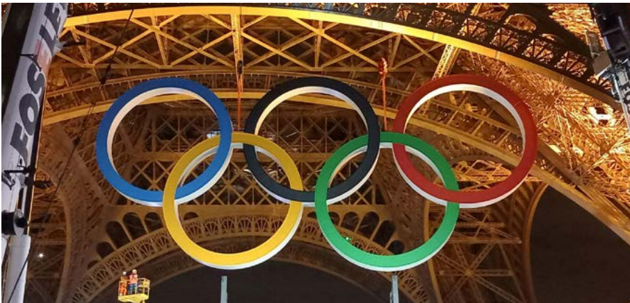
Installation des anneaux olympiques sur la Tour Eiffel