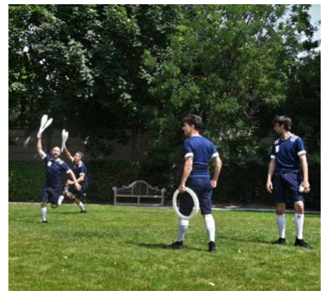
Lancement de l'Olympiade Culturelle en Île-de-France, juin 2023