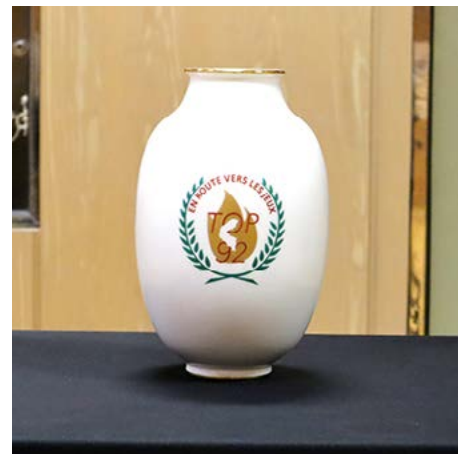
Vase du TOP 92