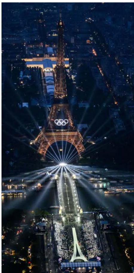
Vue aérienne des anneaux olympiques sur la Tour Eiffel lors de la cérémonie d'ouverture des Jeux Olympiques Paris 2024