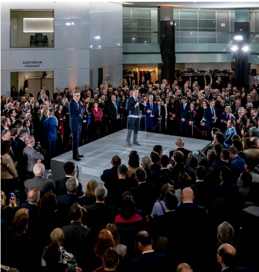
J-500 à la préfecture d'Île-de-France, préfecture de Paris