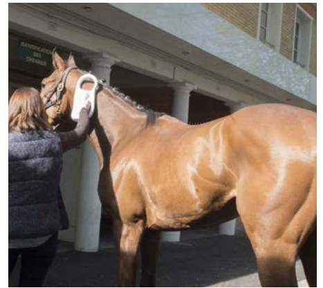
Contrôle vétérinaire, obligatoire pour tous les chevaux à leur arrivée