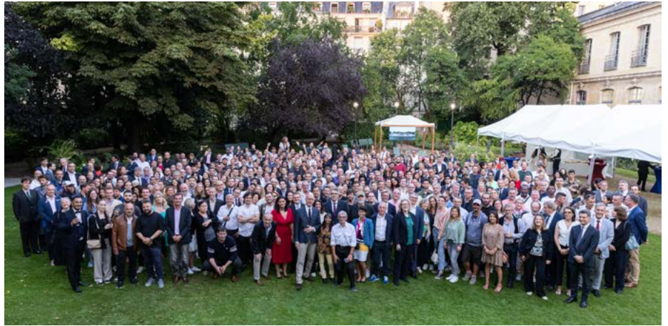
Soirée des acteurs du fleuve pour des jeux Olympiques du 27 juillet 2024