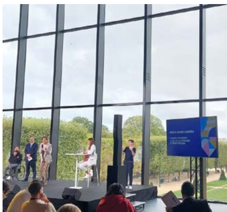
Conférence de presse à l'occasion des J-365 des jeux Olympiques