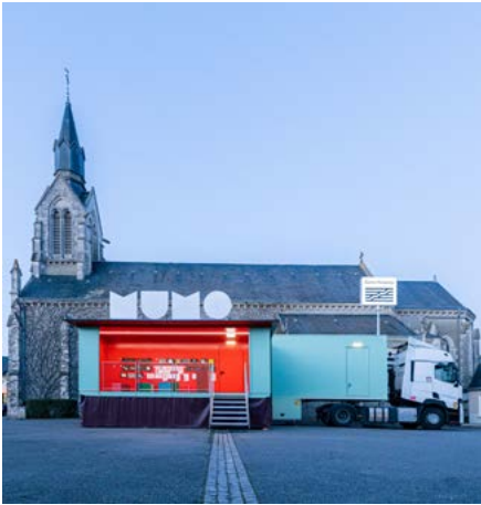
Le MuMo x Centre Pompidou