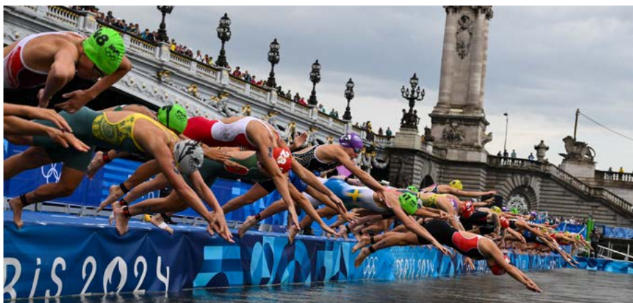
Départ de l'épreuve de triathlon féminin dans la Seine