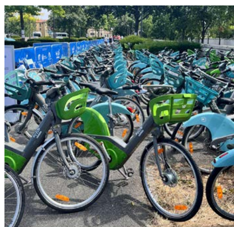
Ensemble de Vélib' durant les jeux Olympiques de Paris 2024