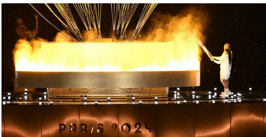
Marie-José Pérec et Teddy Riner allumant la flamme Olympique