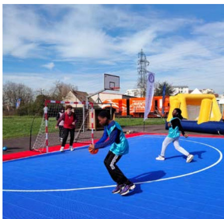
CJ « Saveurs Olympiques » de Villeneuve-la-Garenne