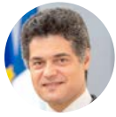
Pierre-Antoine MOLINA Préfet secrétaire général aux politiques publiques

Dès la phase de candidature en vue des Jeux de Paris 2024, l'objectif d'un héritage durable pour la population francilienne a été au cœur de nos préoccupations. Cet héritage, pensé à la fois dans sa dimension matérielle et immatérielle, est le fruit du travail et de l'engagement des services de l'État et de leurs partenaires pour faire des Jeux une réussite non seulement pour les athlètes et les spectateurs du monde entier, mais aussi pour tous les Franciliens.