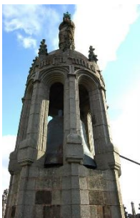
Vues du campanile du clocher

Afin de restaurer la ceinture en pierre de taille qui masque le système métallique sur lequel repose la cloche, il sera nécessaire de déposer cette dernière ainsi que la partie sommitale du campanile avec sa coupole. La dépose de la cloche, prévue le 19 ou 21 novembre 2024 (en fonction des conditions climatiques), sera aussi l'occasion de mieux l'étudier, avant remise en place.