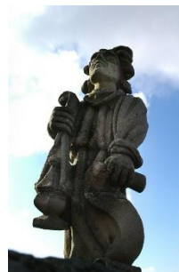
Ange thuriféraire de la tourelle sud-ouest