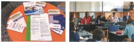
En bas à droite : conférence-permanence pour Aubervilliers, journée pour la lutte contre l'homophobie et la transphobie. Photos libres de droit.

Pour toute aide, téléphonez au 06 1755 1755 ou écrivez à urgence@ravad.org