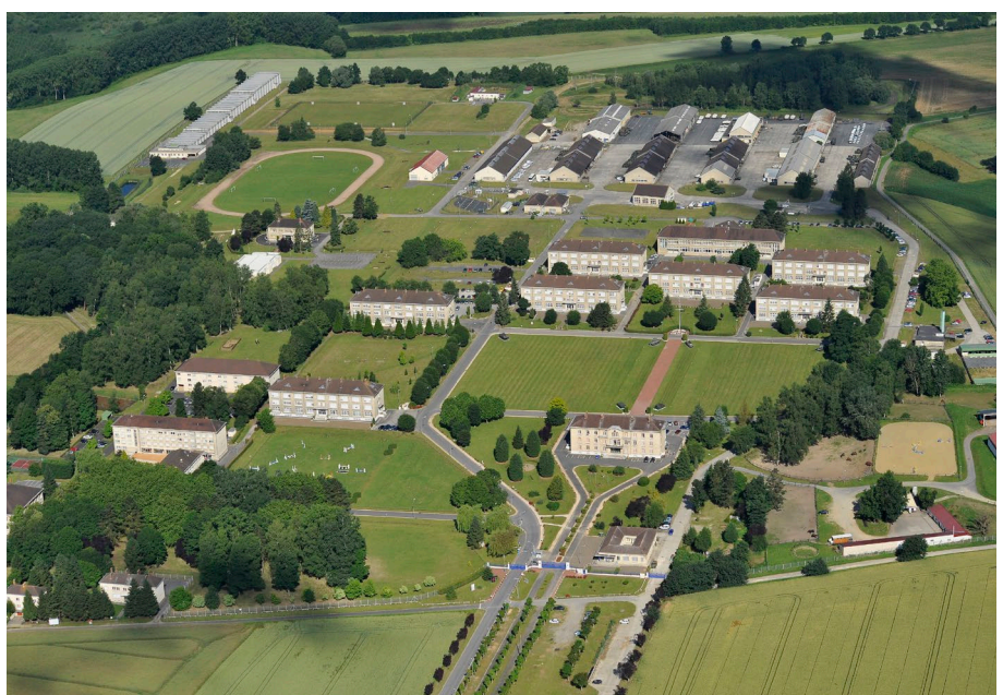
Vue aérienne du quartier Berniquet de Noyon.

Le quartier Berniquet, site de 47 hectares portant 30 bâtiments, a été reconverti à la suite du transfert du régiment de marche du Tchad de Noyon en campus économique « Inovia » dédié aux start-up et entreprises innovantes. Cet écosystème offre ainsi des solutions d'accueil à une cinquantaine d'entreprises générant plus de 250 emplois. Un internat de la réussite (Éducation nationale) y est installé depuis 2010 pour les élèves de la 6 e à la terminale ainsi que des classes préparatoires commerciales. Le site a également été retenu pour accueillir à compter de 2021 des personnels de la Direction générale des finances publiques. Le montant total du contrat s'est élevé à 36,7 M€ dont 10 M€ de crédits État.