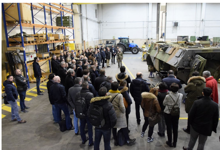
Visite des entreprises au détachement de la 12 e BSMAT de Douai en février 2020.

La déléguée à l'accompagnement régional des Hauts-de-France intervient sur des domaines variés du champ économique et dans la mise en œuvre de la politique ministérielle en faveur des PME (Plan Action PME). Elle assure la mission de point unique d'information du ministère des Armées, en lien avec le correspondant de la Direction générale de l'armement (DGA) en région et à destination des entreprises régionales.