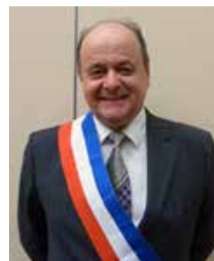
Bernard LEROY , président de la communauté d'agglomération Seine Eure (la CASE) et maire du Vaudreuil

Notre intercommunalité est fortement engagée en faveur de la transition écologique du territoire : qualité de l'environnement et développement plus sobre sont des axes structurants de l'action locale. L'attention portée à la transformation des friches et à la qualité de vie des habitants se concrétise dans ce projet de réhabilitation d'une station Esso en espace public végétalisé favorisant renaturation, biodiversité et lutte contre le réchauffement climatique. »