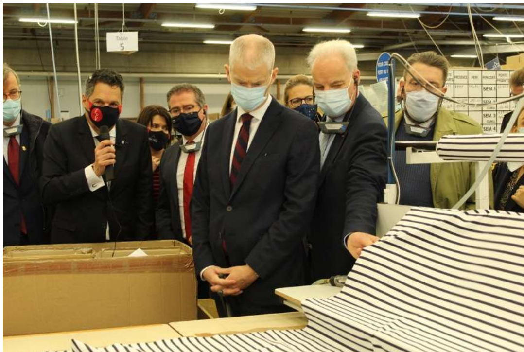
Les ministres Franck Riester et Alain Griset visitant l'entreprise "Tricots Saint-James" lauréate de l'Appel à Projets "Soutien à l'investissement industriel dans les territoires".

La liste des projets, et plus d'informations chaque mois, sur https://www.manche.gouv.fr/Politiques-publiques/Entreprises-economie-emploi-finances-publiques/Le-plan-FRANCE-RELANCE/Le-Plan-France-Relance .