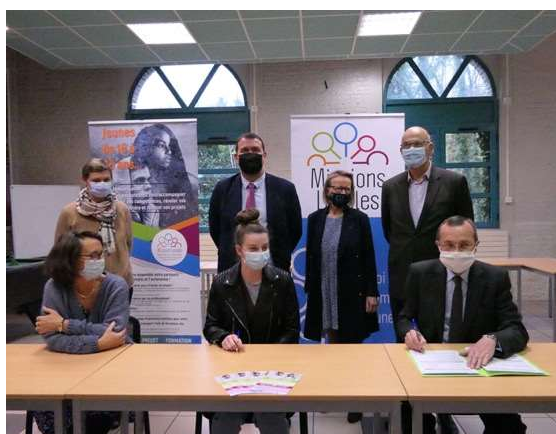
Déplacement du préfet de région à la mission locale de Maromme dans le cadre du volet 1jeune1solution de France Relance.