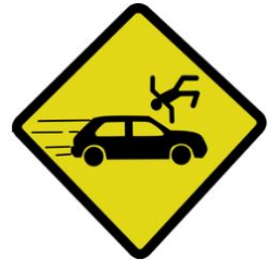
Nombre d'accidents par mois

Le cumul des tués depuis le 1 er janvier enregistre une hausse de 6 tués (soit + 12%) par rapport à la moyenne du cumul 2017/2019. Le nombre de blessés augmente quant à lui de 14 % (soit + 114 blessés) par rapport à la moyenne 2017/2019.