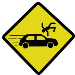
Nombre d'accidents par mois

Le cumul depuis le 1er janvier enregistre une augmentation du nombre d'accidents (+ 99) mais aussi une augmentation du nombre de personnes tuées (+13) par rapport à la moyenne du cumul 2017/2019. Le nombre de blessés augmente également de 4 % (soit + 120 blessés) par rapport à la moyenne 2017/2019.