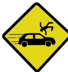
Nombre d'accidents par mois

Le cumul depuis le 1er janvier enregistre une augmentation du nombre d'accidents (+93) mais aussi une augmentation du nombre de personnes tuées (+19) par rapport à la moyenne du cumul 2017/2019. Le nombre de blessés augmente également de 5 % (soit +126 blessés) par rapport à la moyenne 2017/2019.