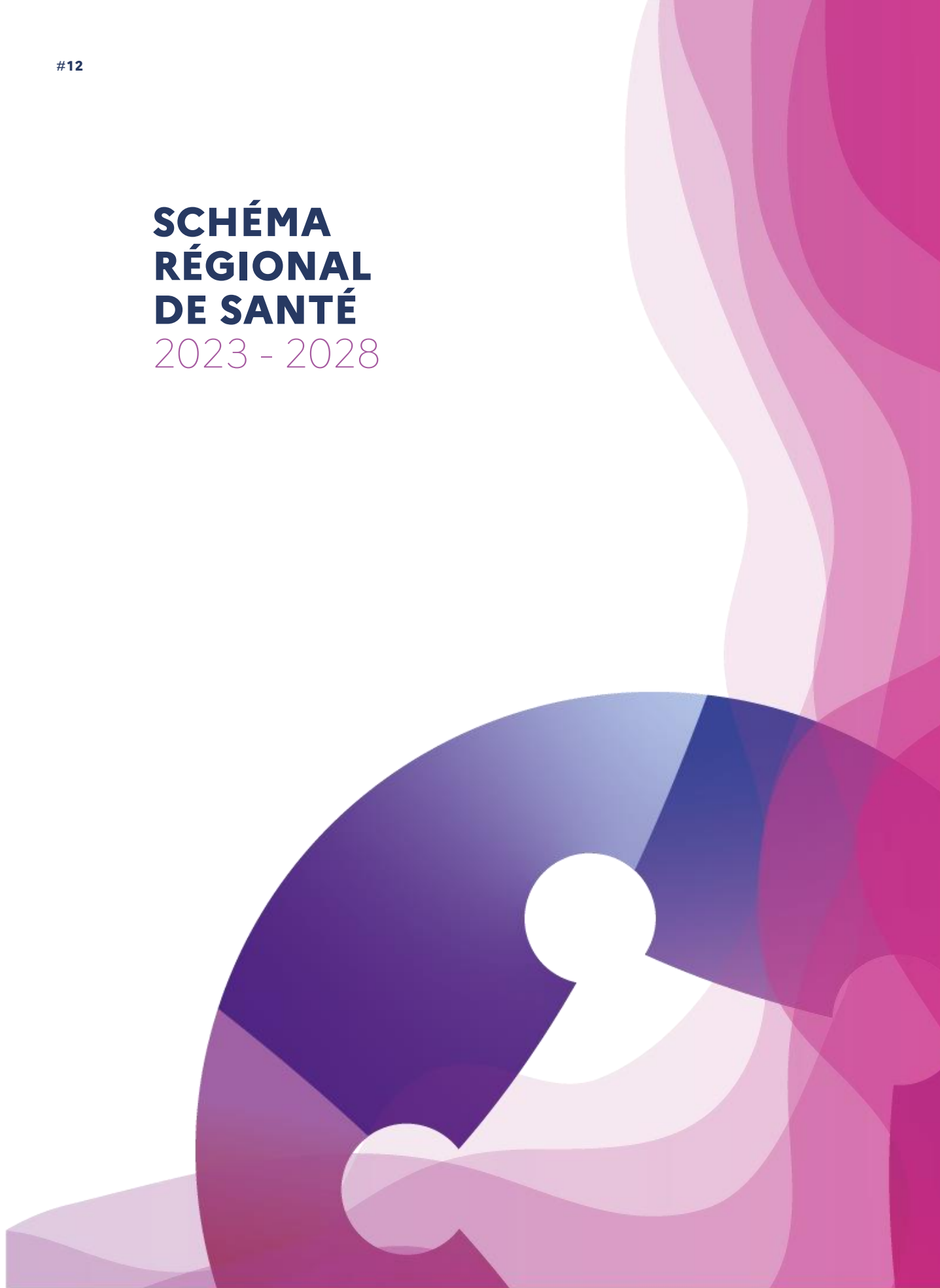
SCHÉMA RÉGIONAL DE SANTÉ 2023 - 2028