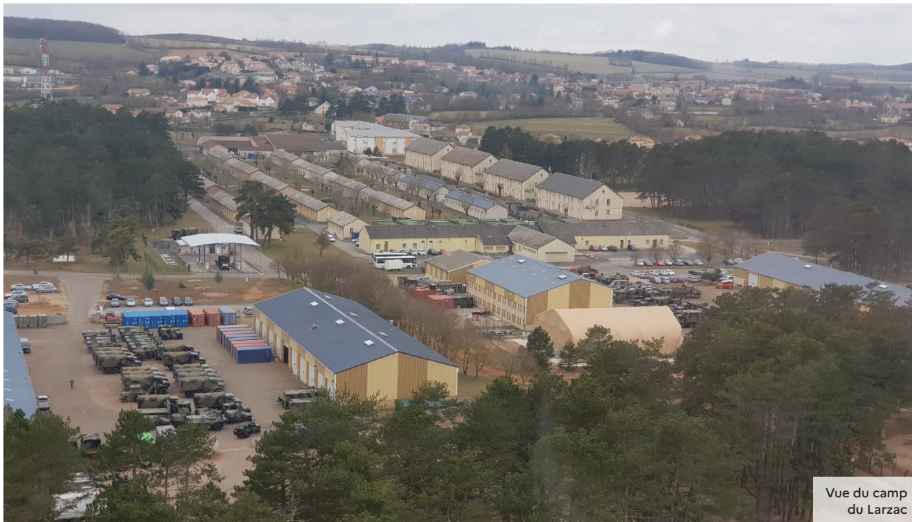
Vue du camp du Larzac