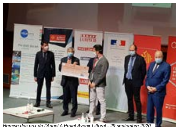
Remise des prix de l'Appel A Projet Avenir Littoral - 29 septembre 2020

Installation du CELMO (Comité Etat Littoral Mer Occitanie) pour une gestion au plus près des besoins pour l'aide de l'Etat aux conchyliculteurs et aux pêcheurs, l'éolien flottant, la rénovation des copropriétés dégradées. Salon du littoral les 28 et 29 septembre, à la Grande-Motte en présence de la Ministre de la mer. Soutien à l'innovation au travers de l'appel à projet Avenir Littoral , ayant permis pour un montant de 2 M€ d'accompagner en 2020, 11 nouveaux dossiers portant à une vingtaine les entreprises accompagnées depuis 2019 ; Aide après la tempête Gloria pour dégager les plages des déchets et des bois flottés avant la saison estivale (300 000 €); Conférence sur le canal Rhône à Sète , pour penser l'avenir du canal.