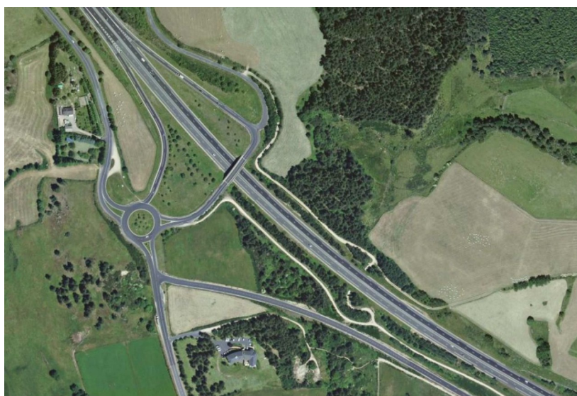
Vue aérienne du demi-échangeur existant