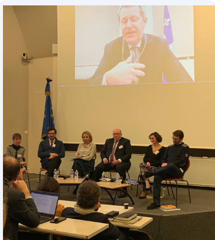
Table ronde « appréhendez les enjeux de la transformation publique »

La PFRH des Pays de la Loire, ainsi que ses homologues de Nouvelle-Aquitaine, de Centre-Val de Loire et de Bretagne, accompagnés des laboratoires d'innovation des préfectures de région étaient présents à la journée de la transformation de l'action publique organisée par l'IRA de Nantes le 1 er février et proposée aux attachés-stagiaires et aux agents de la fonction publique inscrits.