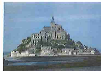
Mont Saint Michel Sortie septembre 2015

La commission culture-loisirs a par ailleurs distribué plus de 10 000 cartes SRIAS gratuites, permettant de bénéficier de tarifs avantageux pour l'achat de places de cinéma et de spectacles auprès de notre partenaire actuel « Tourisme et Loisirs ».