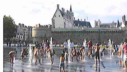
Enfants et miroir d'eau - Nantes

La commission veille également à proposer dans chaque département de la région des conférences sur différentes thématiques permettant de mieux concilier sa vie professionnelle avec ses problèmes familiaux.