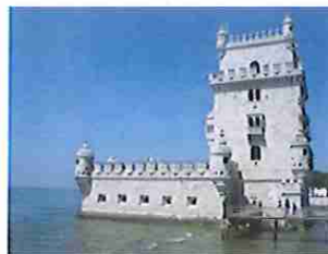
Tour de Belem - Lisbonne

Ce fut aussi, cette année, la visite des machines de l'Iles à Nantes, Terra Botanica et bien d'autres encore. La découverte d'une capitale européenne durant un court séjour (2 à 4 jours) a été également proposée. Après Paris et Bruxelles, c'est Lisbonne qui était à l'honneur en 2015. Dès 2016, ce sera la visite d'une grande métropole française, en alternance avec la découverte d'une capitale européenne.