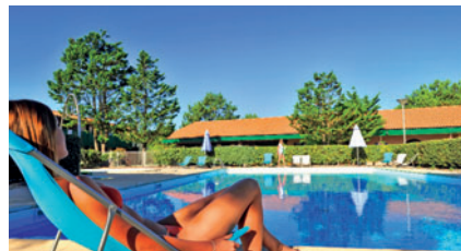
Aquitaine Lacanau "La Forestière"