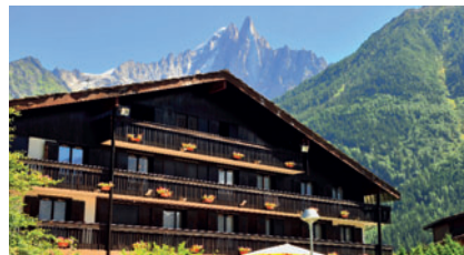
Haute Savoie Chamonix "Les Econtres"