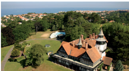
Pays Basque Biarritz "Le Domaine de Françon"

Quelles sont les destinations VTF retenues ?