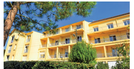
Loire Atlantique Pornichet "Fleur de Thé"